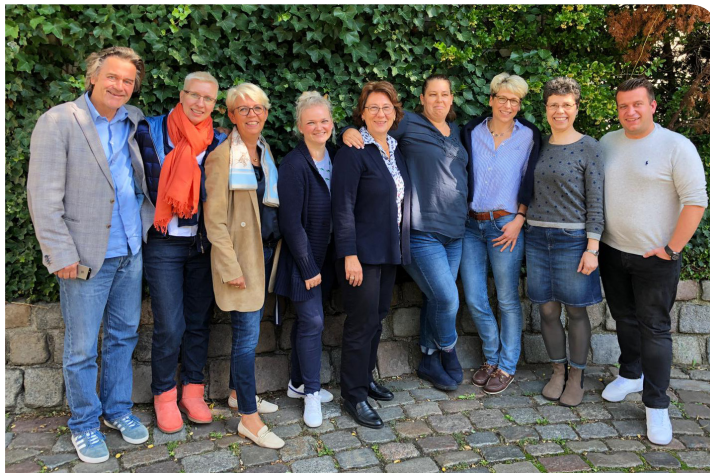
Für Euch am Start: Das JuDerm-Team bei der Jahres- tagung 2019 in Hamburg

Die Artikel aus dem Forum findet Ihr auch online unter aerztliches-journal.de/publikationen